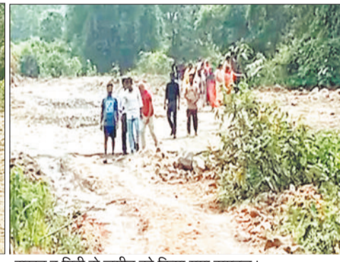
राखड़ व मिट्टी से जमीन को किया गया समतल।