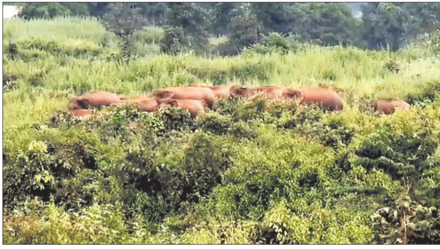
जंगल में विचरण करते हाथी।

हाथियों का दल लालमाटी जंगल से चंद्रा जंगल की ओर बढ़ रहा है। इस दौरान हाथियों को देखने पुरे दिन युवकों की भारी भीड़ उमड़ने के कारण वन एवं पुलिस अमला को कड़ी मशक्कत करनी पड़ी। लम्बे समय से प्रतापपुर एवं सूरजपुर जंगल में भ्रमण कर रहा 25 से 30 हाथियों का दल सोमवार को शहर के निकट महामाया पहाड़ से ग्राम पंचायत खैरबार के अमरा डुग्गु बस्ती में पहुंच गया। हाथियों के शहर के निकट पहुंचने की जानकारी वन अधिकारियों को भी थी लेकिन किसी ने इसे गंभीरता से नहीं लिया। देर शाम हाथियों के पहुंचने से ग्रामीण अपना घर बार छोड़कर भागने लगे तो वन अमले ने सायरन बजाकर हाथियों को बस्ती से दूर खदेड़ने की कोशिश की। बड़ा दल होने के कारण वन अमले को देर रात तक हाथियों को खदेड़ने की मशक्कत करनी पड़ी। इस दौरान पुलिस अमला भी वनकर्मीयों के साथ मौजूद रहा। ग्रामीणों के शाम