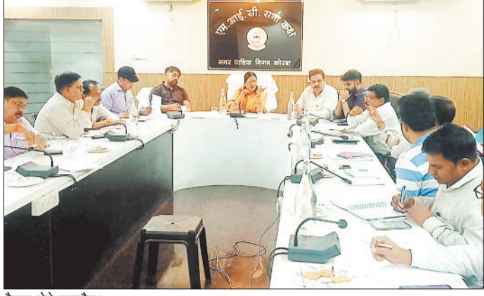
बैठक लेते महापौर।

महापौर ने निगम के अधिकारियों को निर्देशित करते हुए कहा कि निगम क्षेत्र में स्थित समस्त छठघाटों में चेजिंग रूम, पर्याप्त प्रकाश व्यवस्था, पेयजल व साफ-सफाई की बेहतर व्यवस्थाएं सुनिश्चित कराएं, घाटों में पानी की उपलब्धता