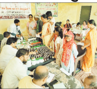
हरिभूमि न्यूज || कोरबा

आयुष विभाग द्वारा जिला स्तरीय आयुष स्वास्थ्य शिविर का आयोजन रिवार को काशी नगर में किया गया। शिविर में आयुर्वेद चिकित्सा पद्धति द्वारा 403 एवं होम्योपैथी चिकित्सा पद्धति द्वारा 104 मरीजों का सफल उपचार किया गया। यह आयुष स्वास्थ्य शिविर छ.ग. राज्य महात्सव के तत्वाधान में वयोवृद्ध मरीजों का विशेष उपचार हेतु आयोजित किया गया। जिसमें वात रोग, चर्म रोग, गुदा एवं मल द्वा रोग मूत्र रोग, एनीमिया, आस्टियो आर्थराइटिस एवं मस्क्यूलोस्केलेटल डिसऑर्डर, मधुमेह, उच्च रक्तचाप, मासिक धर्म में अनियमितता, श्वेत प्रदह, चर्मरोग के