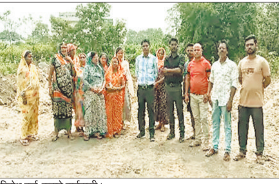
विरोध दर्ज कराते वार्डवासी।

मामला रिसिदी वार्ड के अंतर्गत डिंगापुर में कन्सुमिटी हॉल के पास की एक एकड़ सरकारी जमीन से जुड़ा है। स्थानीय लोगों ने लंबे समय से इस भूमि पर तालाब निर्माण का प्रस्ताव रखा है, ताकि उनकी