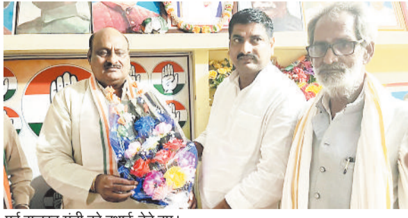
पूर्व राजस्व मंत्री को बहाई देते हुए।